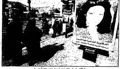
المرشحة العراقية من حزب الدعوة (أخضر)